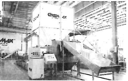
発泡スチロール減容機「MCC3000」

環境関連機械の製造販売等を手掛けるINTCO GREEN MAX社(米国)は、発泡スチロール減容機の製造販売を行って