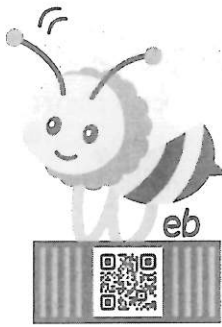
「産廃コンテナbee」のロゴ